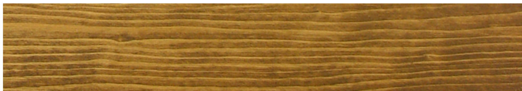
150-82 égetett umbra