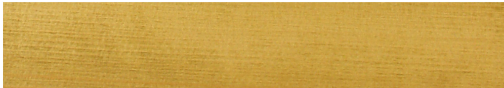
150-85 umbra natúr