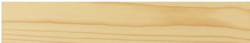
150-90 ásványi fehér